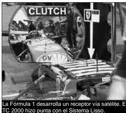
La Fórmula 1 desarrolla un receptor vía satélite. El TC 2000 hizo punta con el Sistema Liso.

La agencia Ansa indicó que "la Fórmula 1 dio un paso al frente en cuestión de seguridad de cara a 2007". El último viernes, durante los entrenamientos oficiales para el Gran Premio de Alemania, los pilotos probadores de BMW Sauber, Williams, Red Bull y Midland tuvieron "su primera toma de contacto con un nuevo sistema que la Federación Internacional del Automóvil pretende introducir el año que viene". Mediante un GPS (sistema de posición global mediante satélite), los pilotos pueden "conocer al instante si los comisarios deportivos exponen alguna bandera avisando de una situación de peligro".